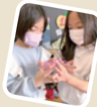
仲良く 二人あやとり