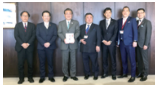
株式会社 エイト様