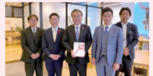
株式会社 住宅工営様