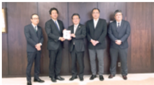
八王子・高尾・南大沢遊技場組合様