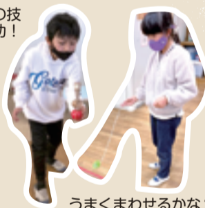
うまくまわせるかな?